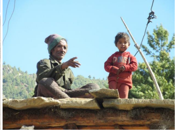
Limi Trekking

Das Limi-Tal ist eines der entlegensten und bemerkenswertesten Täler im nord-westlichen Nepal im Distrikt Humla oder dem Karnali. Das Tal erinnert an die tibetische Landschaft, mit trockenem und wüstenartigem Gelände, umgeben von sehr hohen Bergen. Die meisten der Einwohner der Region sind von tibetischer Herkunft und ihre Kultur und Tradition werden vom tibetischen Lebensstil beeinflusst. Die Stämme, Nyinba, Bynsi, Limipa und Khampa leben dort in Hütten aus Stein, verputzt mit Erde. Ihren Lebensunterhalt bestreiten sie mit Viehzucht. Der längste Fluss in Nepal der Karnali fließt durch das Tal und macht es sehr fruchtbar, was an einer Vielzahl von seltenen Pflanzen und Tieren wie wilden Yaks, Rehe, Blauschafen, Moschusochsen, Wildpferde, den Himalaya-Schwarzbären und sogar der gefleckte Schneeleopard gesehen werden kann. Das Tal ist erst seit 2002 für Touristen geöffnet und es gibt nur ein paar wenige Trekkingrouten. Geleitet wird dieses Trekking in 2019 von einem staatlich geprüften Berg- und Skiführer aus unserem AMICAL alpin Team.