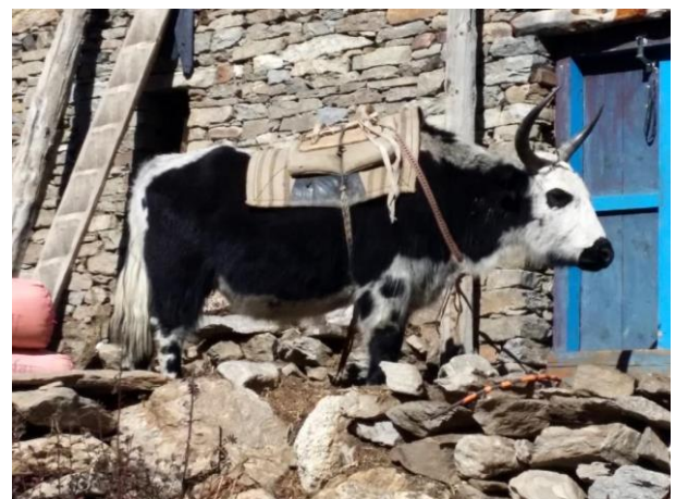
Limi Trekking

Das wunderschöne Dorf Til ist auf 4.050 m einer der höchstgelegenen ganzjährig bewohnten Orte. Im Hintergrund steht der Nalakangar Himal. Vom Dorf aus sind spektakuläre Gipfel zu erblicken. Hier oben werden Gerste, Weizen und Kartoffel angebaut. Hier wird auch hervorragender Chang gebraut.