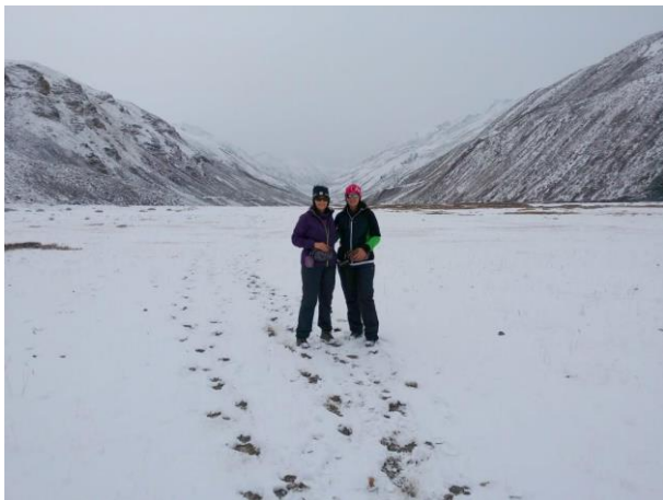
Limi Trekking

Der Nyalu Pass ist ein Pass nördlich von Kerma. Der Pass überquert den Tiefpunkt auf dem Kamm des Tarchila Himal. Die Schwierigkeit des Passes liegt nicht in der Höhe von 4.998 m, sondern in den schnell wechselnden Wetter- und Schneeverhältnissen. Mit seinen steilen Hängen und seiner Abgeschiedenheit sollte er nicht unterschätzt werden. Schnee liegt hier meist von Oktober bis April – im Winter ist ein Übergang über diesen Pass eigentlich unmöglich.