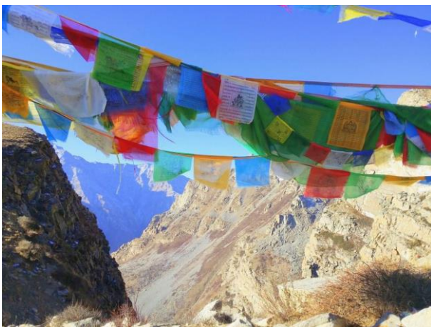
Limi Trekking

Da das Tal erst seit 2002 für den Trekkingtourismus geöffnet wurde, gibt es hier noch sehr einsame Wege und Routen. Daher ist das Gebiet von modernen Veränderungen unberührt und es wird gesagt, dass dies die gegenwärtige Form des mythischen Shangri-La sei.